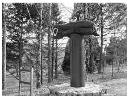
シアトルの広場 その1